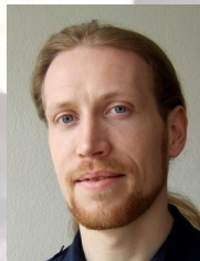
Ch. Stussak Mitglied der Fachgruppe Mykologie Halle